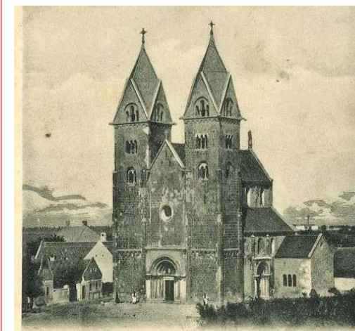
A lébényl Árpád kori templom.