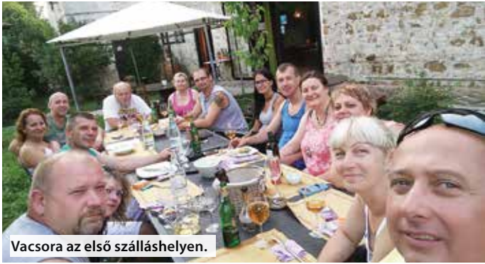
Vacsora az első szálláshelyen.

Aztán elérkezett a várva várt június 25-e. Szép napos időben indultunk útnak és tudtuk, hogy ez még csak a kezdet. Lévéni motorokról szó nagyon sokat számít az időjárás ahhoz, hogy minden a tervek szerint haladjon. Az utunk szinte végig autópályán haladt ezért az első napi 550 kilométer elérhető volt. Többszöri megállás, 1ebéd és tankolás után megérkeztünk az első szálláshelyre, amely már olasz részen az Alpok lábánál volt. Gyors ismerkedés a házigazdával, utána pedig elfoglaltuk a szobáinkat. Nos, az ottani étkezési szokások merőben eltérnek az itthon megszokottól és ez egész utunk során végigkísért.