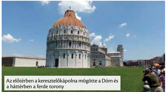
Az előtérben a keresztelőkápolna mögötte a Dóm és a háttérben a ferde torony

Úgy beszéltük meg hogy szerdán Firenzébe megyünk és többek között megnézzük az Uffizi képtárat is. A szállásunktól mintegy 80 kilométerre lévő Firenze közlekedése, mondjuk úgy, hogy a motorozáshoz szokott embert is