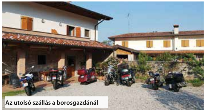
Az utolsó szállás a borosgazdánál

Pénteken elindultunk Udine felé ahol az utolsó szálláshelyünk volt. Az út meglehetősen nyugodtan telt, leszámítva a 34 fokot és egy kis dugót Bologna mellett. A szállás egy bortermelő gazdánál lett lefoglalva és nem is okozott csalódást. Mindenki meglegedésére megkóstoltuk a finomabbnál finomabb olasz borokat.