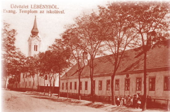
Az 1875-ben épült evangélikus iskola 1911-ben.