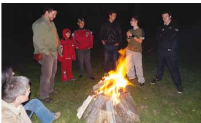
A fél tízre tervezett tűzgyújtást kicsit korábban ejtettük meg, mert az időjárás nem a mi oldalunkon állt és elkezdett esni az eső.

Vasárnap délután felbőgtek a kompresszorok és pár perc múlva már rúgtuk