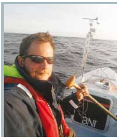
Rakonczy Gábor (Budapest, 1981. január 28.)

Kétszeres Guinness világrekorder óceáni evezős, az amerikai Év kalandja díj és a Magyar Formatervezési Díj tulajdonosa, négyszeres óceánátkelő magyar hajós. Rendszeresen tart előadásokat egyetemeken és felsővezetői képzéseken, eddig 5 országban, több mint 25 ezer ember hallotta célmegvalósítással kapcsolatos előadásait.