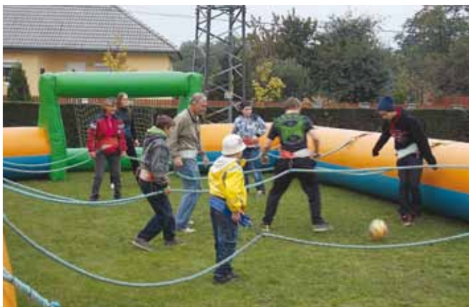
2013. szeptember 28-án és 29-én került megrendezésre a „Magyarország Szeretlek” programsorozat, melynek során az ország összes településén változatos programokkal várták az érdeklődőket.