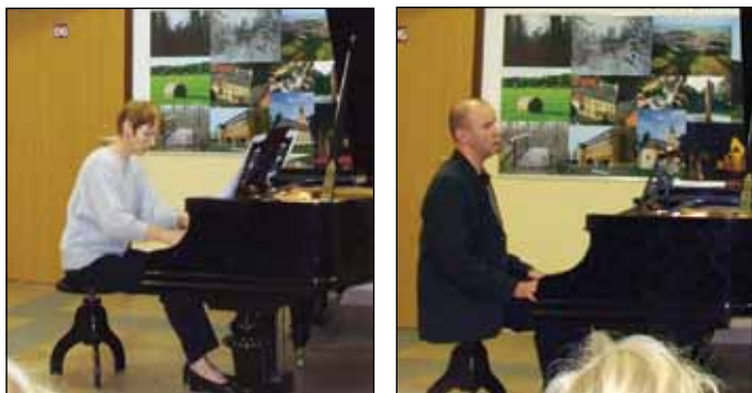
A zeneiskola tanárai második alkalommal emlékeztek ünnepi koncerttel a zene világnapjára.