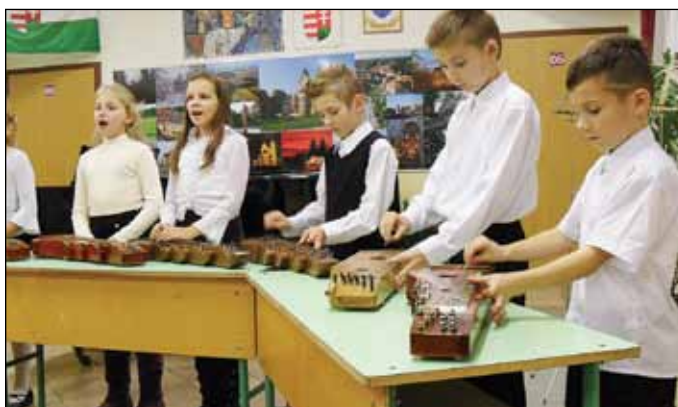
Az októberi tanári koncert után most a diákoké volt a főszerep a lébényi általános iskolában.