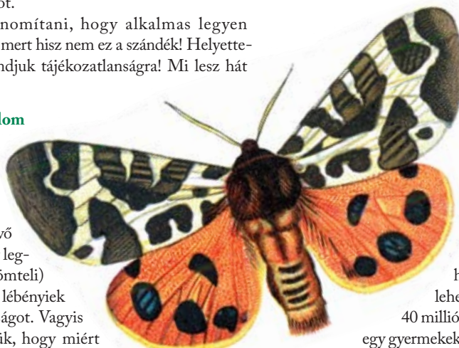
Közönséges medvelepke ( Arctia caja )

A múlt év nyarán – önerős beruházással – felújítottuk az iskola auláját. Ennek tökéletes folytatása lehet, amiről nemrég kaptunk értesítést: ennek az épületnek az akadálymentesítésére benyújtott pályázatunk támogatást nyert a Nyugat-dunántúli Operatív Programból. Ezzel kapcsolatban még nagyon a dolgok elejénél tartunk, „csak” a pozitív döntésről szóló hivatalos értesítés van a kezünkben, de nem nehéz kiszámolni, hogy itt is megkezdődnek a munkálatok amint lehet, mert még idén el kell számolni a közel 40 millió forinttal, amit erre a projektre kapunk. (Mivel egy gyermekekkel teli épületben nem lehet dolgozni, záródik az időelő: ennek el kell készülnie idén nyáron...)