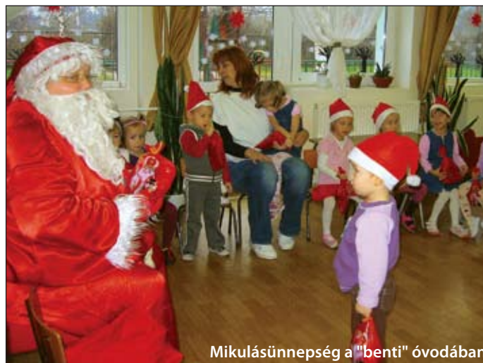
Mikulásünnepség a "benti" óvodában