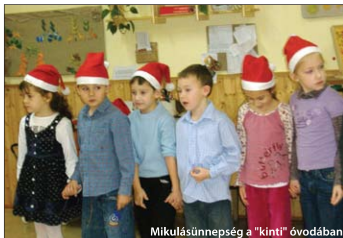
Mikulásünnepség a "kinti" óvodában