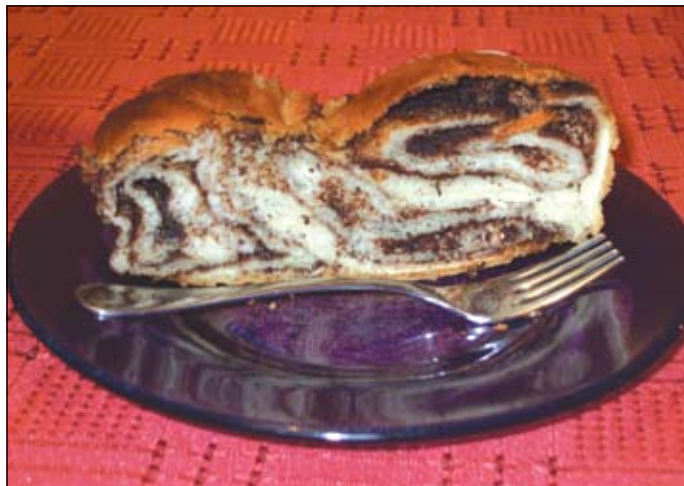
Köszönjük a receptet Buga Imrénének.

Tészta: 70 dkg liszt, 5 dkg élesztő, 4 dl tej, 6 dkg cukor, 2 evőkanál étolaj, pici só, 3 tojás sárgája. Először felfuttatjuk az élesztőt a langyos tejben a cukorral. Mikor ez kész, hozzáöntjük a többi összetevőhöz, bedagasztjuk, megkelesztjük. Töltelék: 25 dkg Rámát kikeverünk 20 dkg porcukorral, 3 evőkanál kakaót, 2 csomag vaníliás cukrot adunk hozzá, majd belekeverjük a felvert 3 tojás fehérjét. A tésztából 6 cipót formálunk, egyenként kinyújtjuk, megkenjük. 3-3 rudat összefonunk, fél órát még tepsiben pihentetjük, majd magas hőfokon rövid ideig sütjük.