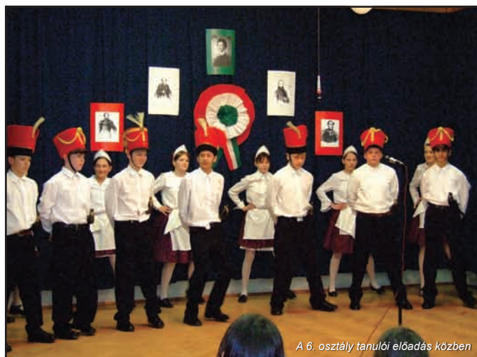
A 6. osztály tanulói előadás közben