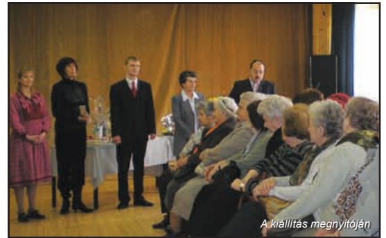
A kiállítás megnyitóján