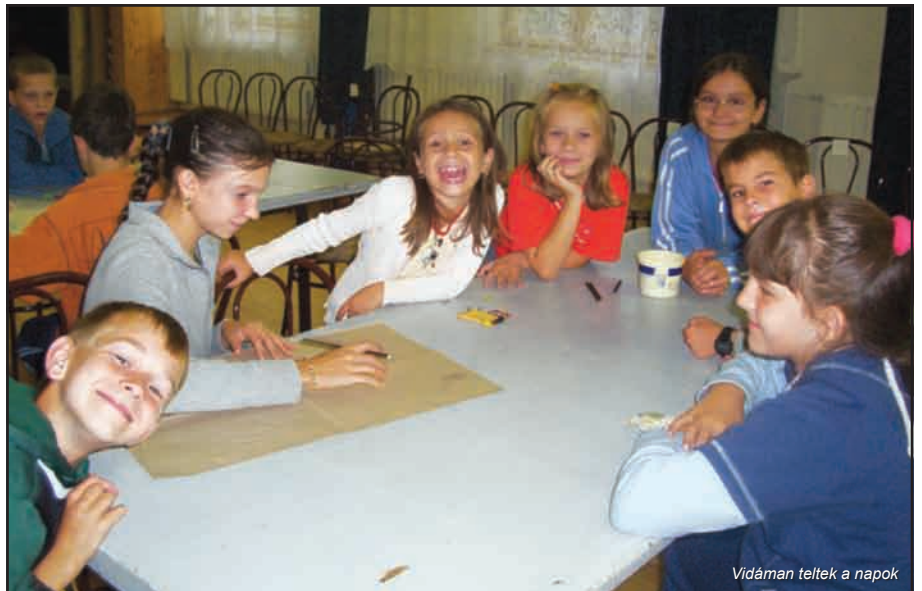
Vidáman teltek a napok

Mi mindennel foglalkoztunk? Batikoltunk: pólót, trikót, terítőt, agyagoztunk, só-liszt gyurmáztunk, gyöngyöt fűztünk: karkötőt, állatkákat (egeret, pókot, méhecskét, krokodilt stb.), origamiztunk: kövér halacskákat, dundi tulipánokat, papírból alkottunk: meghívót, papírtasakot, ceruzatartót, borítékot, virágot, képkeretet, dobozt. Varrtunk: virágot, fonalgrafikát, indiánfonatokkal tértek haza a lányok, és az arcfestés után sok-sok tündér, kutyus, cica hagyta el a Közösségi Házat. Szalmatechnikáztunk, csuhéztunk, decoupage-technikával ismerkedtünk, kifestőt, gipszképet-gipszfigurákat festettünk, mozaikoztunk. Dekorgumiból alkottunk hűtőre, ceruzára valót. Szárazvirág kompozíciót készítettünk, magmandalát. Közben ettünk-ittunk, málnaszörp-től bajuszunk nőtt, szendvicstől nagyra nőttünk.