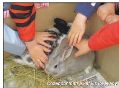
Középpontban a két kis jövevény

Hímestojások és más dísz tárgyak készültek