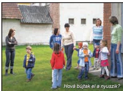
Hová bújták el a nyuszik?

Nagy várakozással készültünk erre a foglalkozásra, mert a közelgő ünnepekre való tekintettel a Klub kis vendégeit meglátogatta két, szelíd nyuszi. Lehetett őket simogatni, nézni, és még (mivel mindannyian jó gyerekek voltunk) ajándékot is hoztak magukkal: hímes tojásokat.