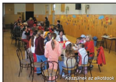
Készülnek az alkotások