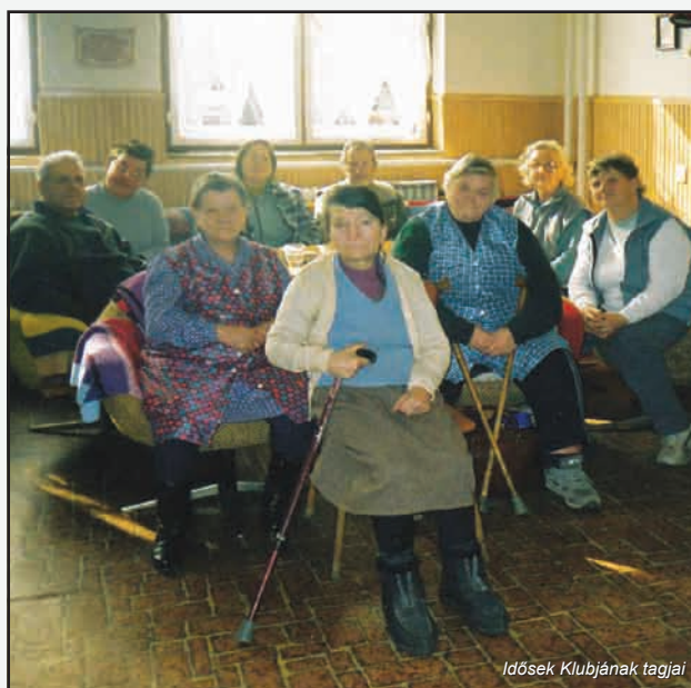
Idősek Klubjának tagjai